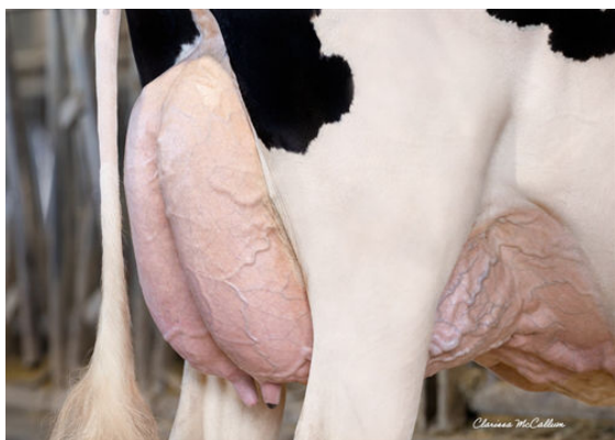
PROGENESIS LARSON KELLEY DAM