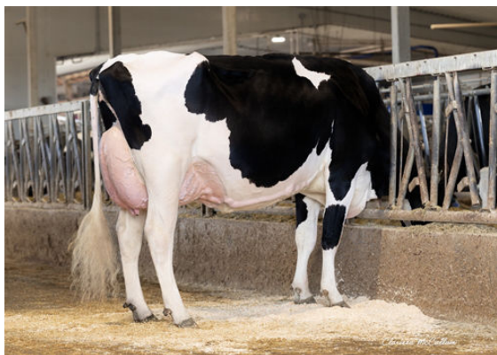
PROGENESIS LARSON KELLEY DAM