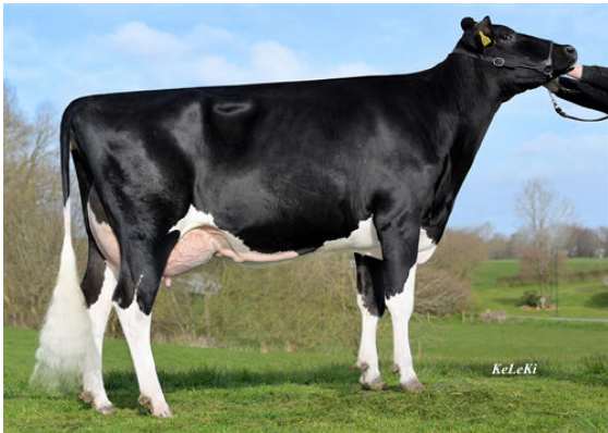
OFH VICKY GRANDDAM