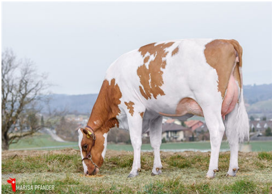
OFH SOLITAIR HOKOVITRED PP DAM