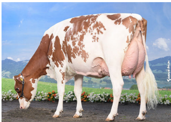
HELLENDER POWER BAILEYS