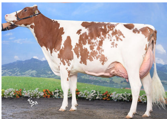
HELLENDER POWER BAILEYS