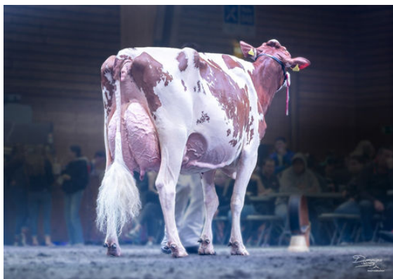
HELLENDER POWER BAILEYS