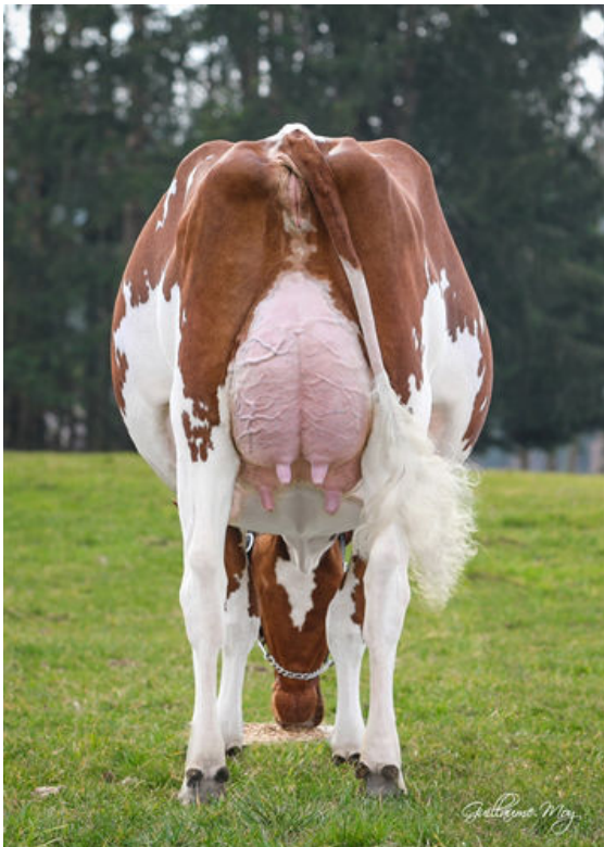
LONDALY CROWN JELENA DAM