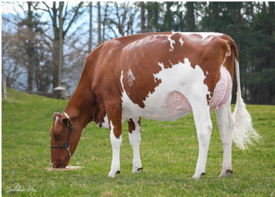
LONDALY CROWN JELENA DAM