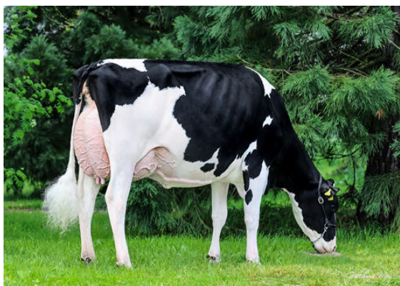
LA WAEBERA LETSGO IDEALE GRANDDAM