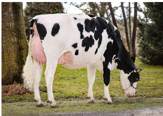
LA WAEBERA DELTA-LAMBDA ILLUS DAM