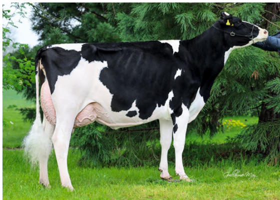
LA WAEBERA LETSGO IDEALE GRANDDAM