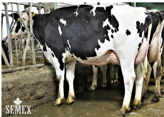
BERNI SUPERMAN DIVA