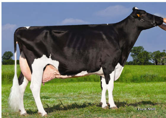
PIROLO O-MAN STUPENDA FIFTH DAM