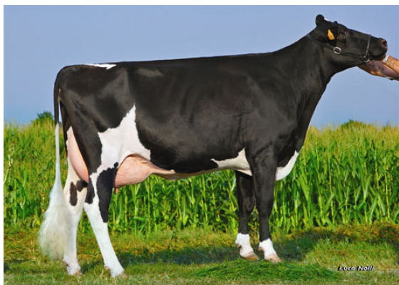
PIROLO GOLDWYN SCHADY FOURTH DAM