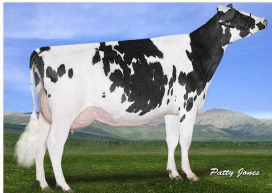
GOLD-N-OAKS MVP ARIA2815 DAM