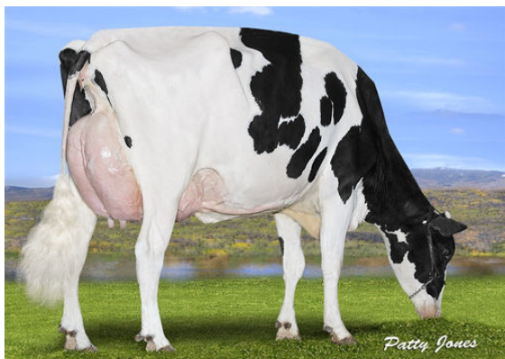
PROGENESIS DENVER BETSY DAM