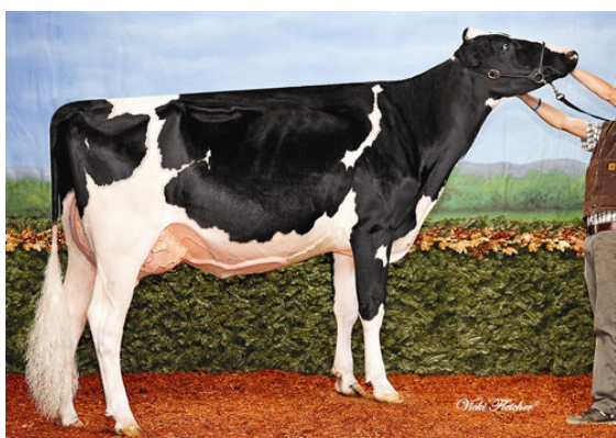
RALMA-RH MANOMAN BANJO FOURTH DAM