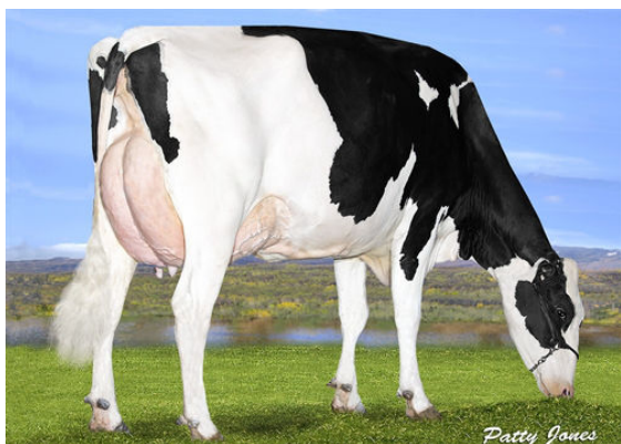
OCD DELTA MISSY GRANDDAM