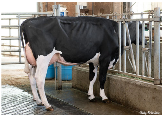
PROGENESIS FASTBALL PRISSY