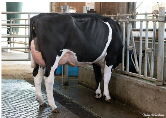
WESTCOAST FSTBL FAR8167 10707