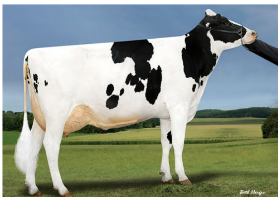
SANDY-VALLEY SLV ESSENCE