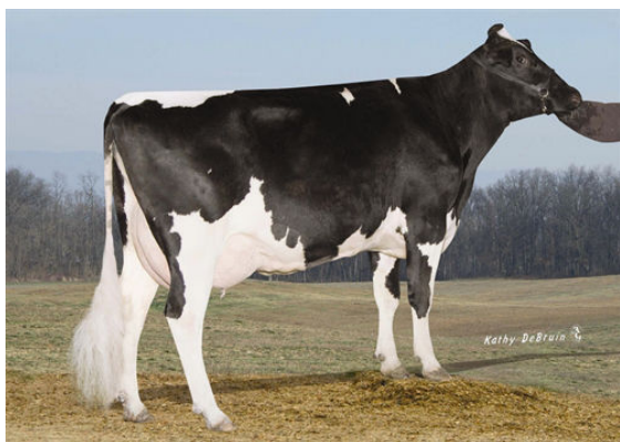
PINE-TREE MONICA SUELA FIFTH DAM