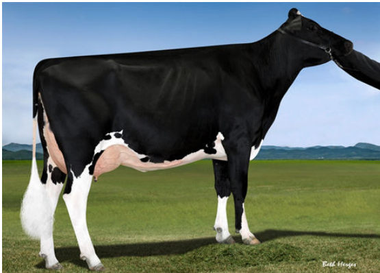
FAIRMONT TUFFENUFF RIDGE FOURTH DAM