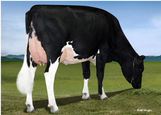
FAIRMONT TUFFENUFF RIDGE FOURTH DAM