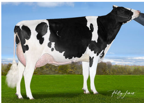
VOGUE PADAWAN ELUSIVE-P