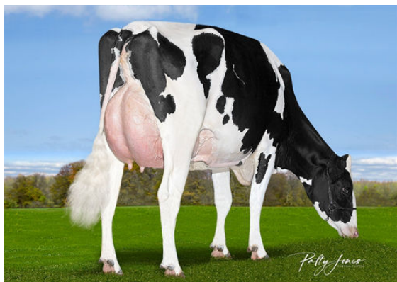
VOGUE PADAWAN ELUSIVE-P