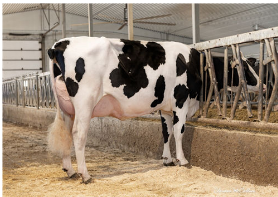
PROGENESIS PERKY PEPITA DAUGHTER