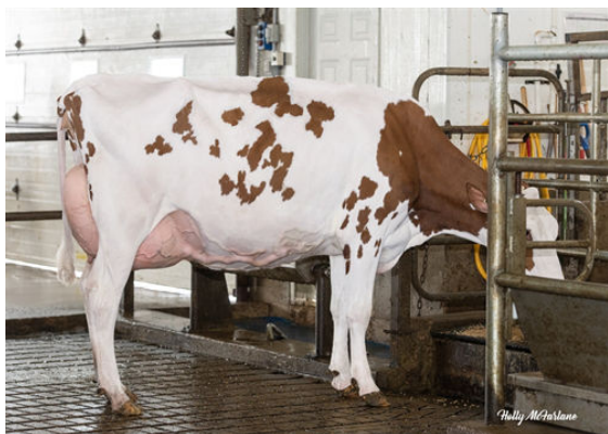
VOGUE MIRAND RED WINE-PP DAM