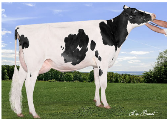
JOSEY-LLC UNO SANGARIA FOURTH DAM