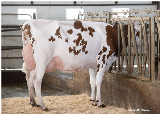
VOGUE MIRAND RED WINE-PP DAM