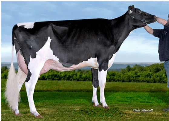
FEPRO PERFECT LINDOR DAM