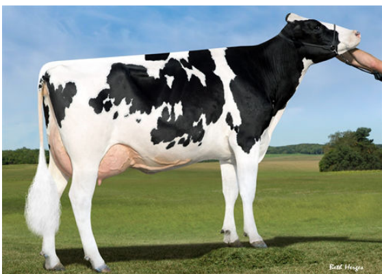
SANDY-VALLEY MORGAN ERA