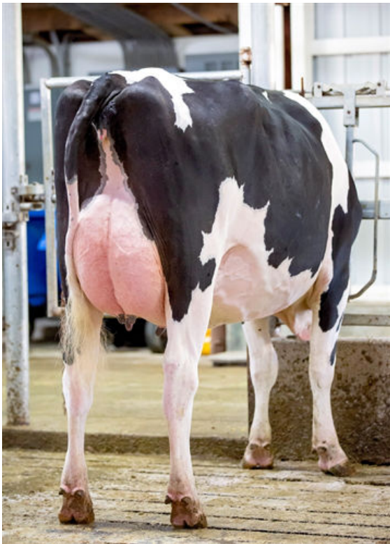
SANDY-VALLEY G ESCAPADE