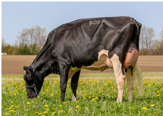
JACOBS PERFECT BRINK