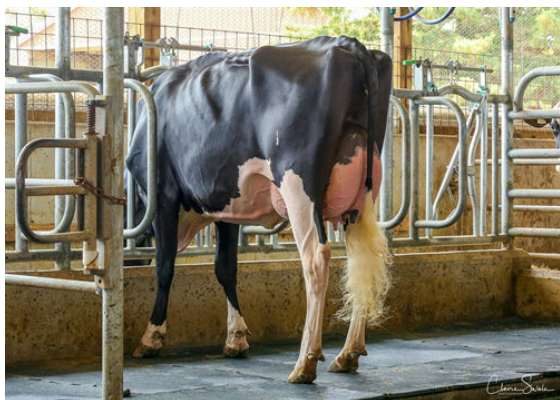
JACOBS PERFECT BRINK