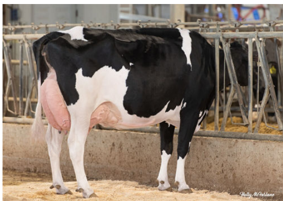
PROGENESIS ZAZZLE PAPRIKA