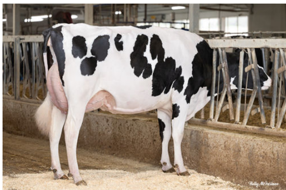
PROGENESIS ROYALFLUSH PAPAYA