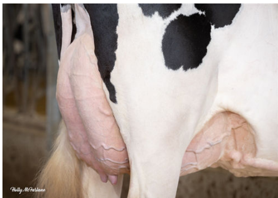
PROGENESIS ROYALFLUSH PAPAYA