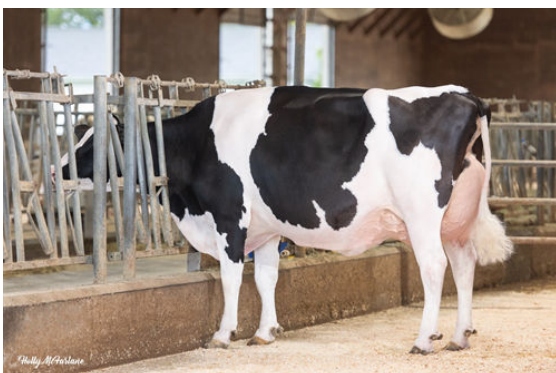
MYSTIQUE LAMBDA ANIS GRANDDAM