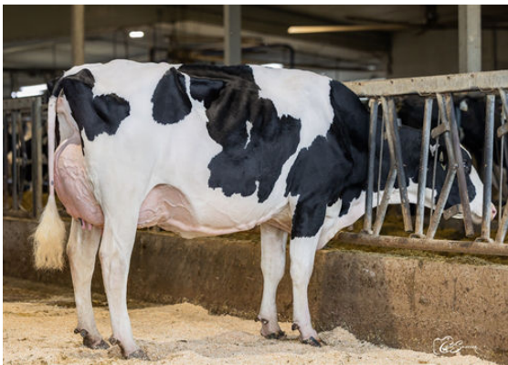
PROGENESIS RANGER ANTHEM DAM