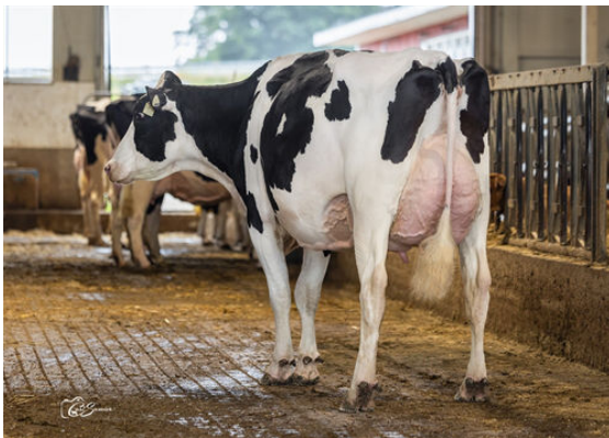
PROGENESIS RANGER ANTHEM DAM