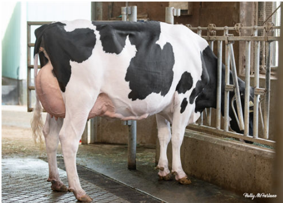
PROGENESIS GAMEDAY TITANIA