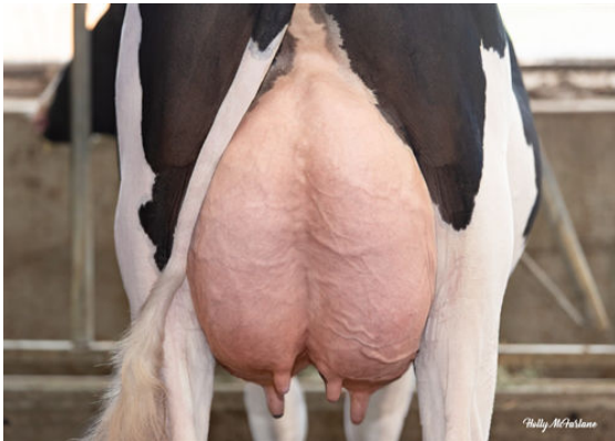
PROGENESIS GAMEDAY TITANIA