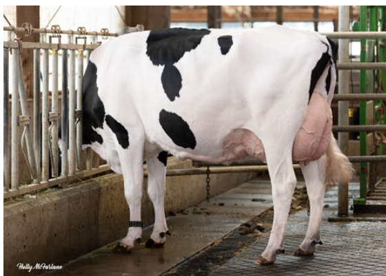
PROGENESIS ZAZZLE PRACTICE