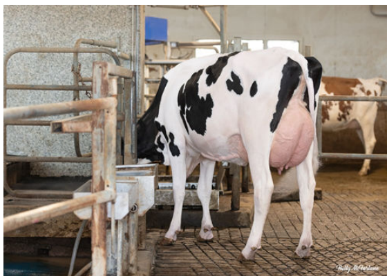
PROGENESIS JALAPENO PEPPY