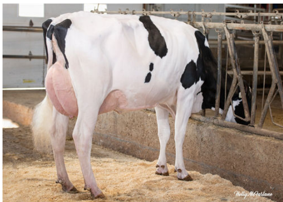
PROGENESIS JALAPENO PEPPY