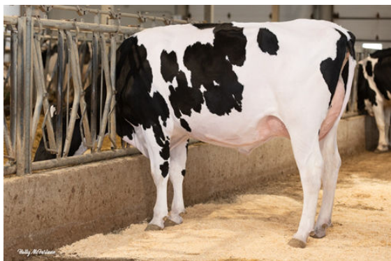
PROGENESIS CONWAY PRESLEY