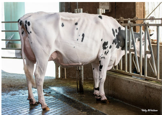
PROGENESIS BOMBA PARAGON