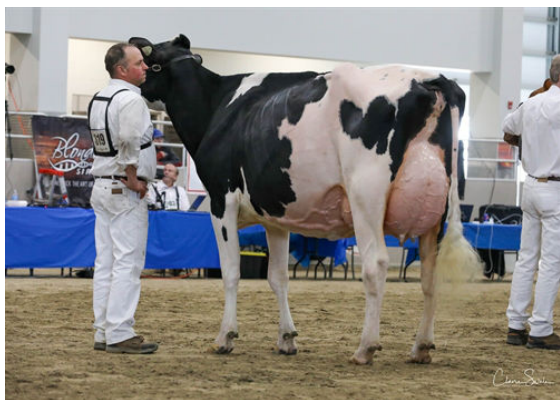
FRAELAND DOORMAN BOURBON GRANDDAM

MB-LUCKYLADY BULLSEYE FRAELAND ALLIGATOR BOMBAY EX-90-4YR-CAN STANTONS ALLIGATOR FRAELAND DOORMAN BOURBON EX-91-2E-CAN VAL-BISSON DOORMAN FRAELAND GOLDWYN BONNIE EX-95-3E-CAN 25*