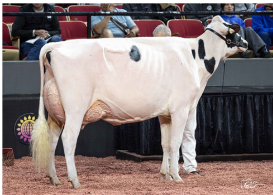
WALNUTLAWN LAMBDA BEYONCE