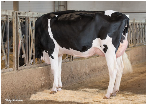
PROGENESIS RANGER LAYLA DAM