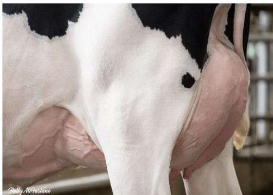
TERRA-LINDA MGNM FIERCE