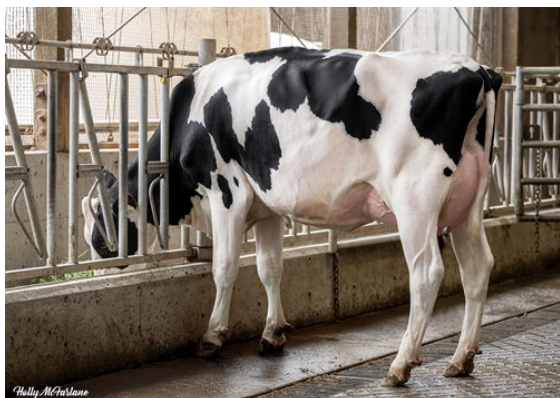
TERRA-LINDA MGNM FIERCE