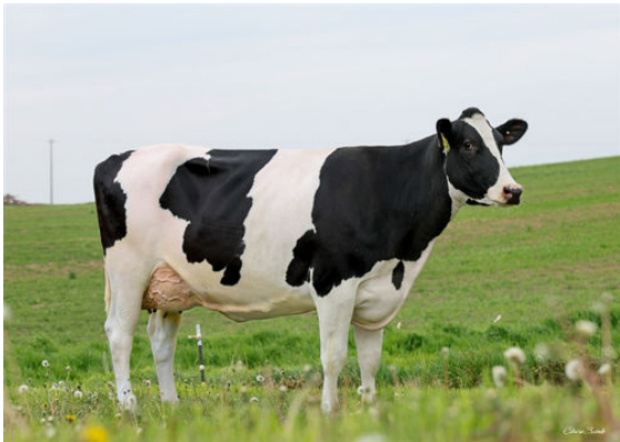
FLY-HIGHER RELIANT SALSA GRANDDAM