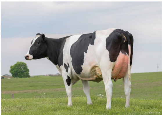
FLY-HIGHER RELIANT SALSA GRANDDAM