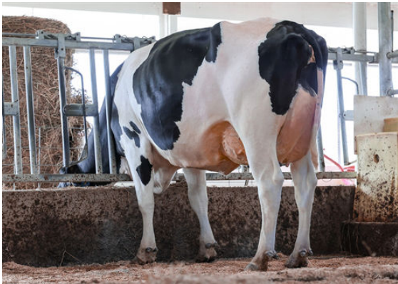
FLY-HIGHER RELIANT SALSA GRANDDAM