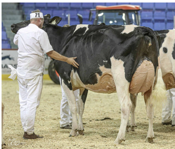
JACOBS SIDEKICK LOONY GRANDDAM