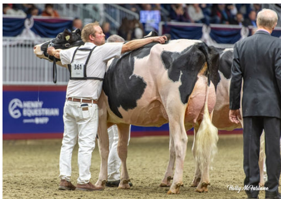
JACOBS ALLIGATOR LORELLA DAM