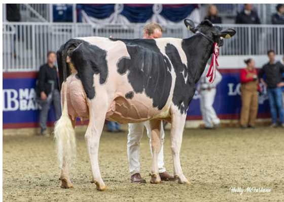
JACOBS ALLIGATOR LORELLA DAM