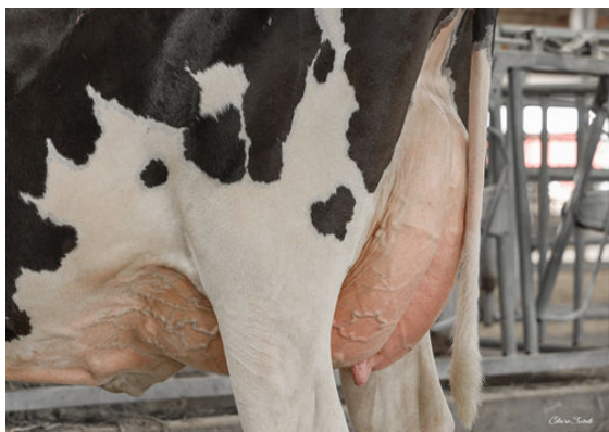
SIEMERS DRBO HANAN 39846