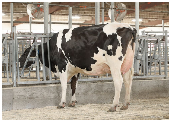
SIEMERS DRBO HANAN 39846