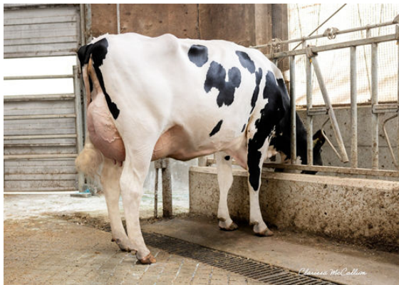
PINE-TREE SHEEP MILLENIA