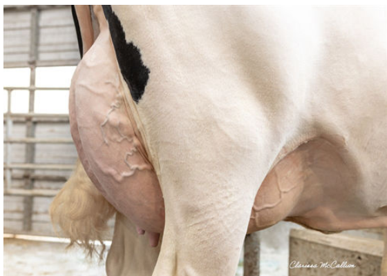
PINE-TREE SHEEP MILLENIA