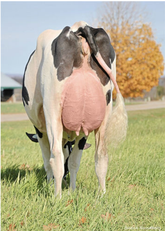
MYSTIQUE ALLIGATOR ALCATRAZ DAM