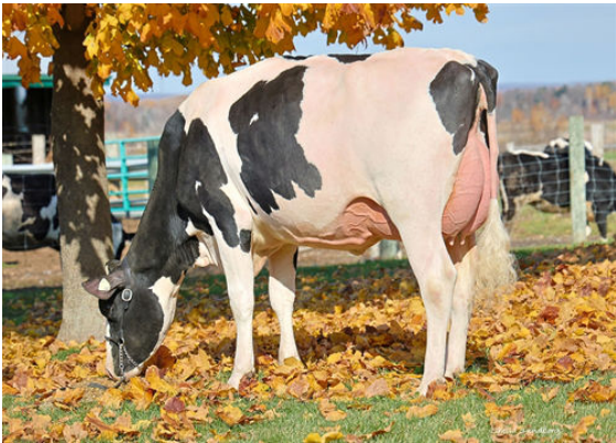
MYSTIQUE ALLIGATOR ALCATRAZ DAM