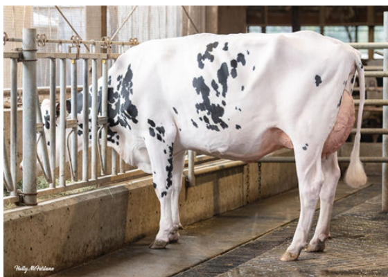
PROGENESIS RANGER PARADISE