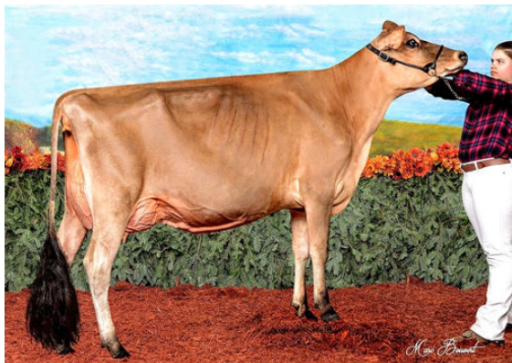
DULET JOEL BRIOCHE