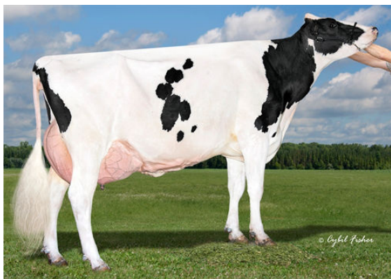
QUIET-BROOK-D YODER LASSLY GRANDDAM