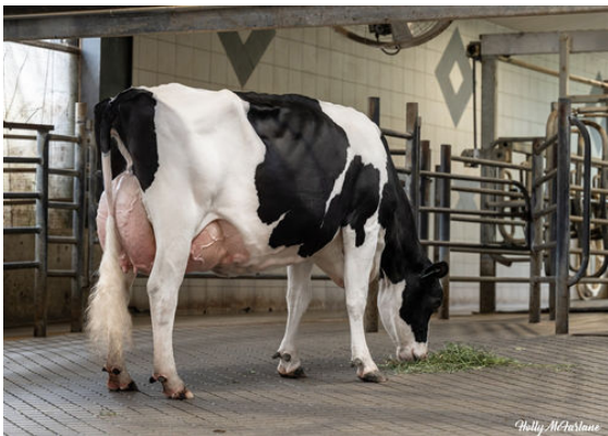
PROGENESIS EINSTEIN RUDY DAUGHTER