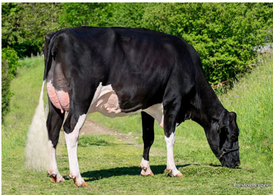
HOKOVIT EINSTEIN GENIA 1 DAUGHTER