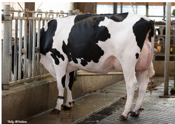
WESTCOAST MNTBLNC FR8167 11529 DAUGHTER