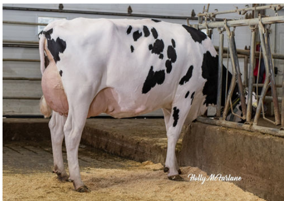
PROGENESIS JEDI MENACE GRANDDAM