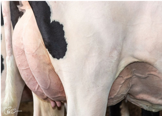
PELLERAT PATTERN 5955

L TO R - PELLERAT PATTERN 6642, 5958, 5964 AND 5955