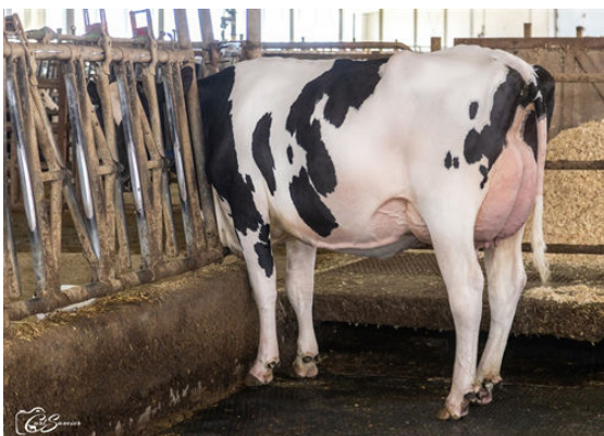
PELLERAT PATTERN 5955