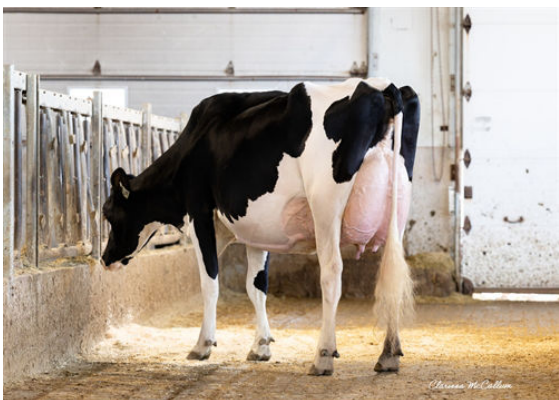
PROGENESIS LARSON KELLEY DAUGHTER