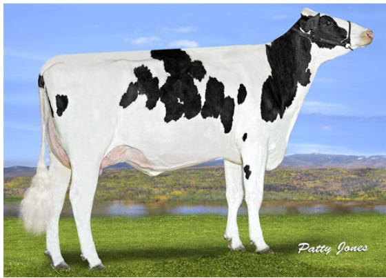
PROGENESIS MONTANA BEAUVAIS