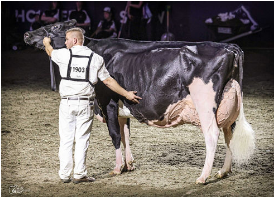
ALTONA LEA UNIX HERMINIE DAUGHTER