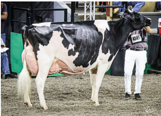
GLENIRVINE UNIX SALLY DAUGHTER