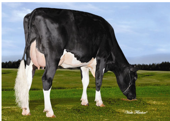
DESSAUGES MUSKETEER KESHA