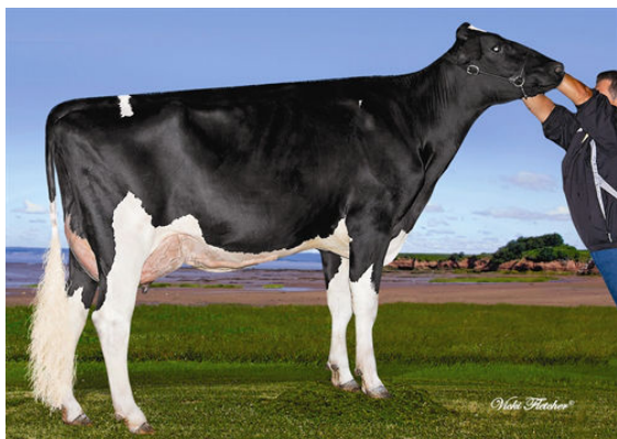
VALLEYVILLE MUSKATEER TALOR