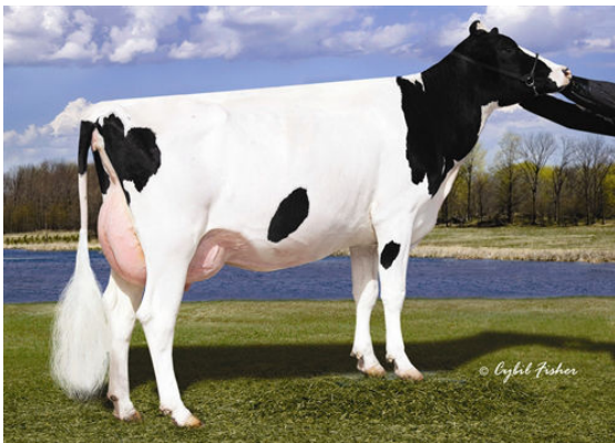
SEAGULL-BAY MISS AMERICA THIRD DAM