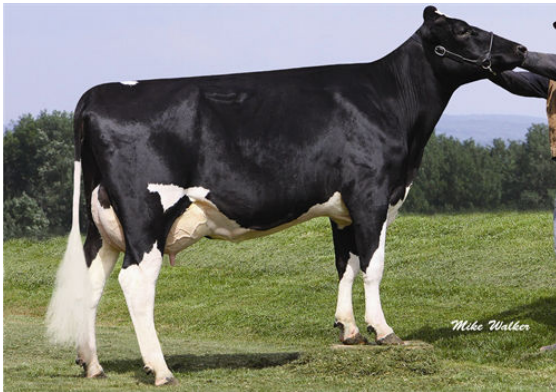
COYNE-FARMS FREDDIE JILL FIFTH DAM