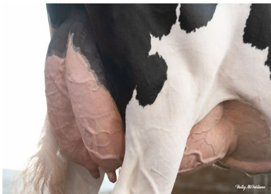
PROGENESIS YODA PALOMA