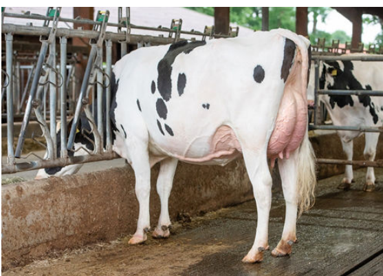
GRIMMELMANN'S BE HOT DAUGHTER