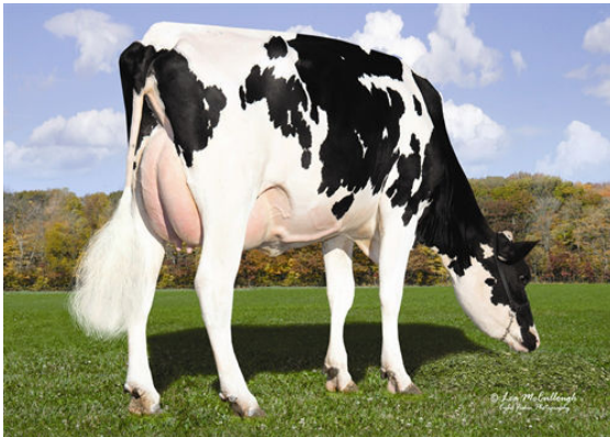
OCD MAN-O-MAN FANTOM FIFTH DAM